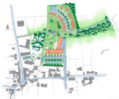
Plan d'implantation, QUADRA

Le projet en est encore au stade de l'esquisse mais la méthodologie du montage du dossier est susceptible de nous inspirer.