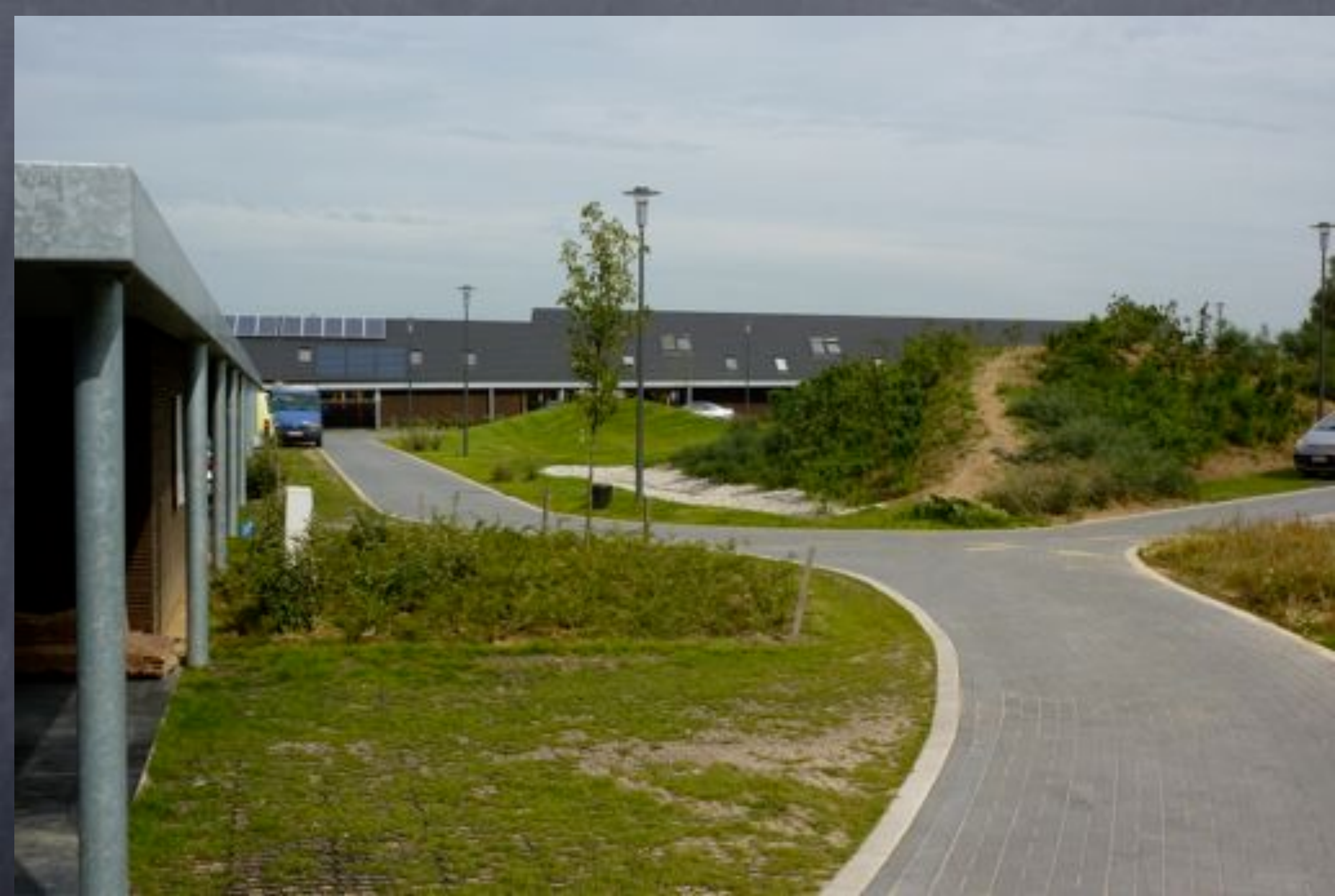
Tournai, Pic au vent, architectes Q.Wilbaux-E.Marchal