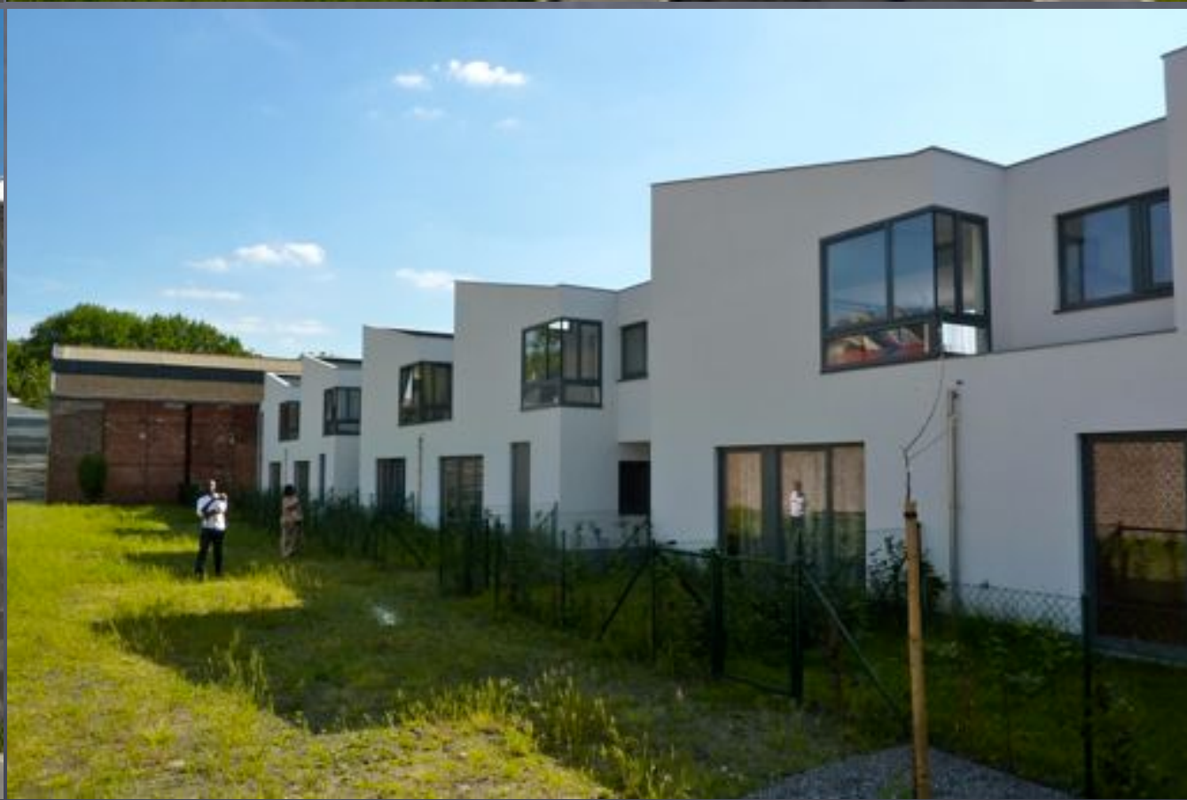
Liège, St Léonard, espaces publics et partagés