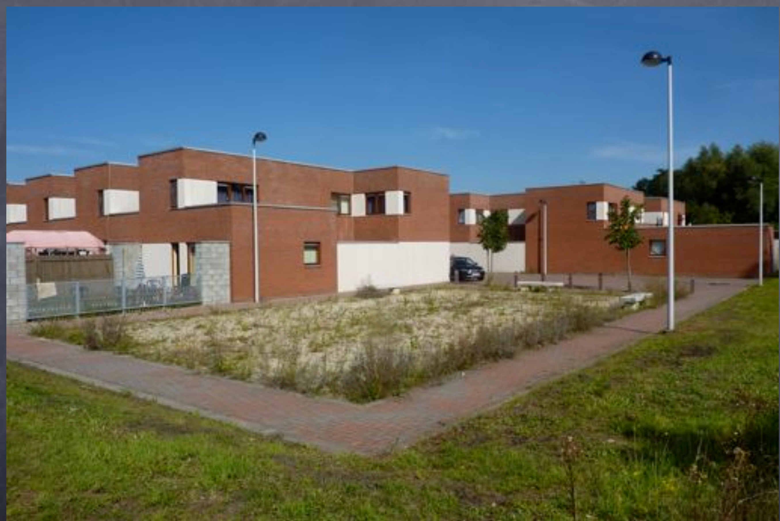
La Louvière, Mitant des camps, arch. Topati Architects