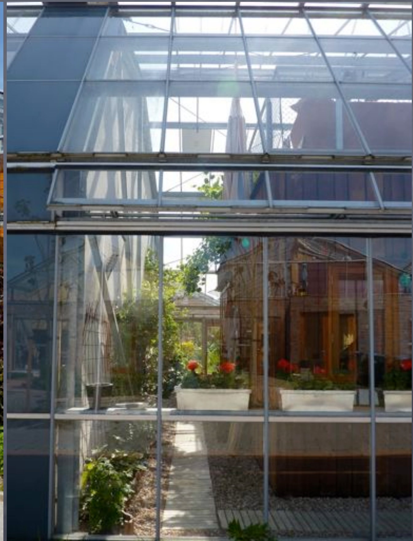
Culemborg, EVA Lanxmeer, KWSA architecten