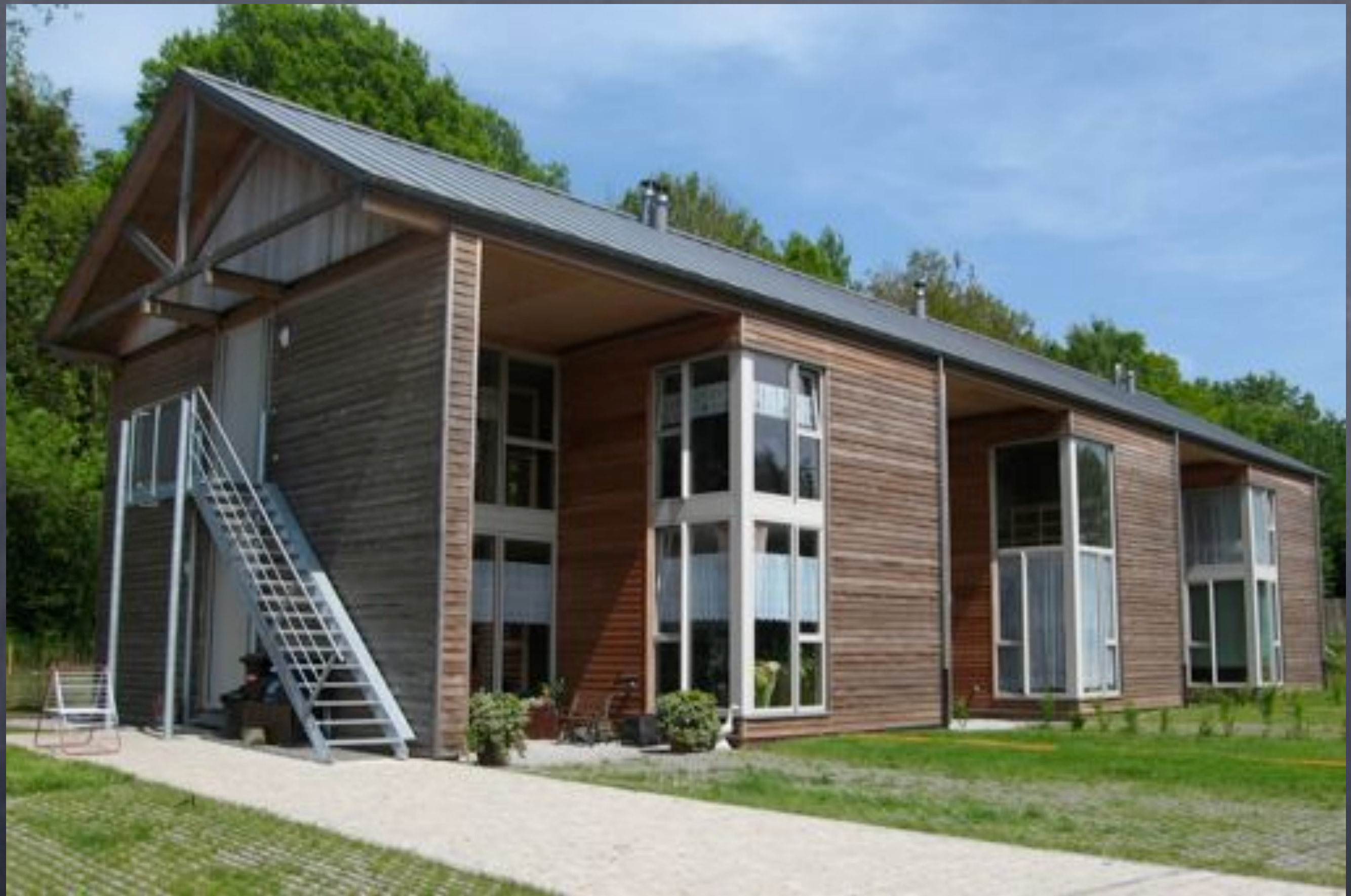
Mettet, Pontaury, architecte La Pierre d'angle