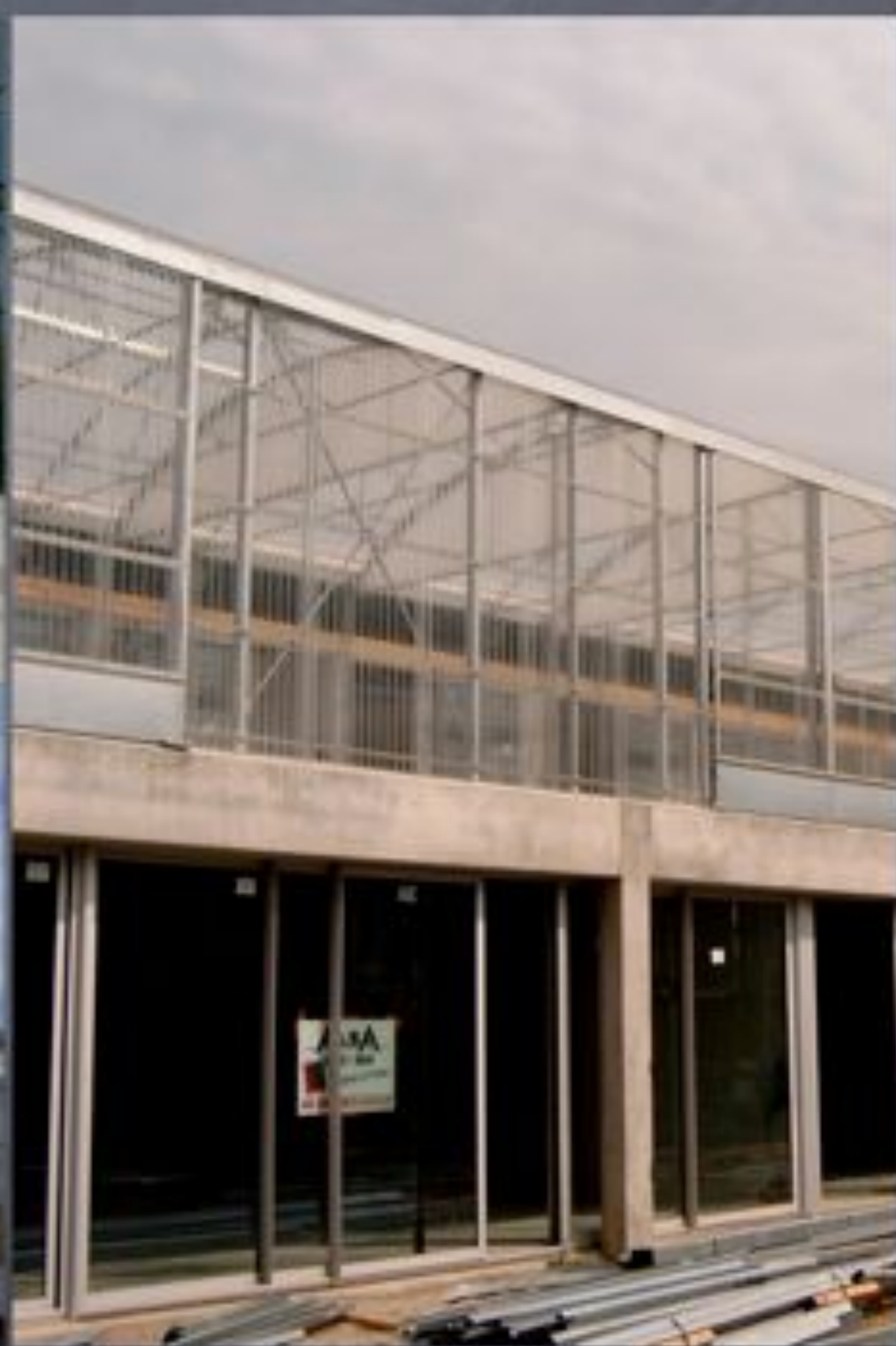
Mulhouse, cité Manifeste, arch. Lacaton-Vassal