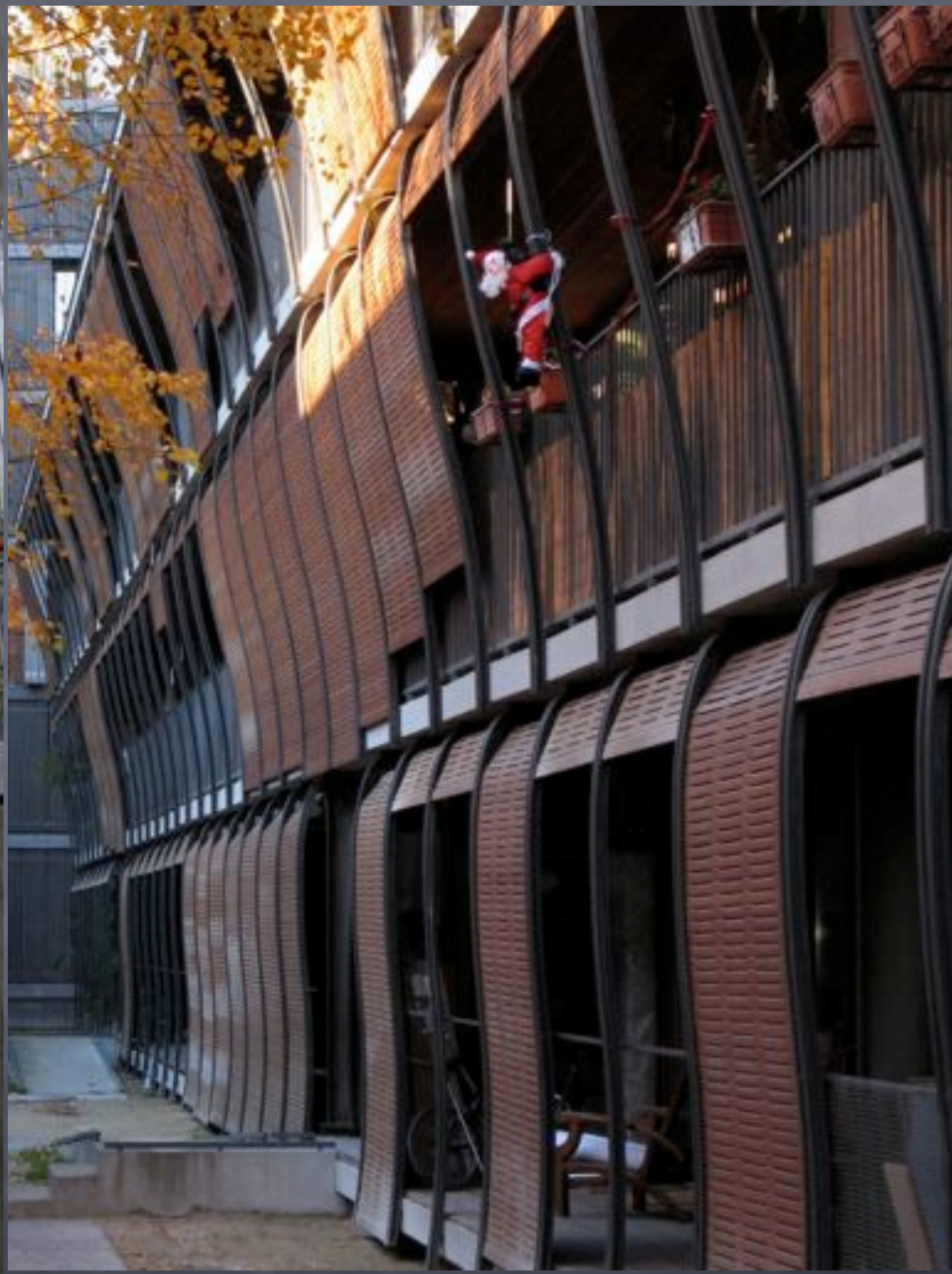
Paris (14), rue des Suisses: arch. Herzog et De Meuron