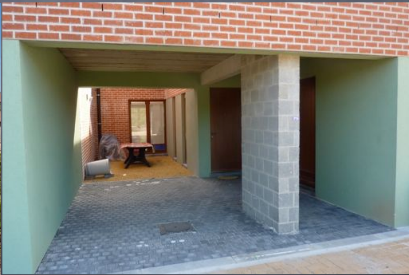
La Louvière, Mitant des camps, les composants