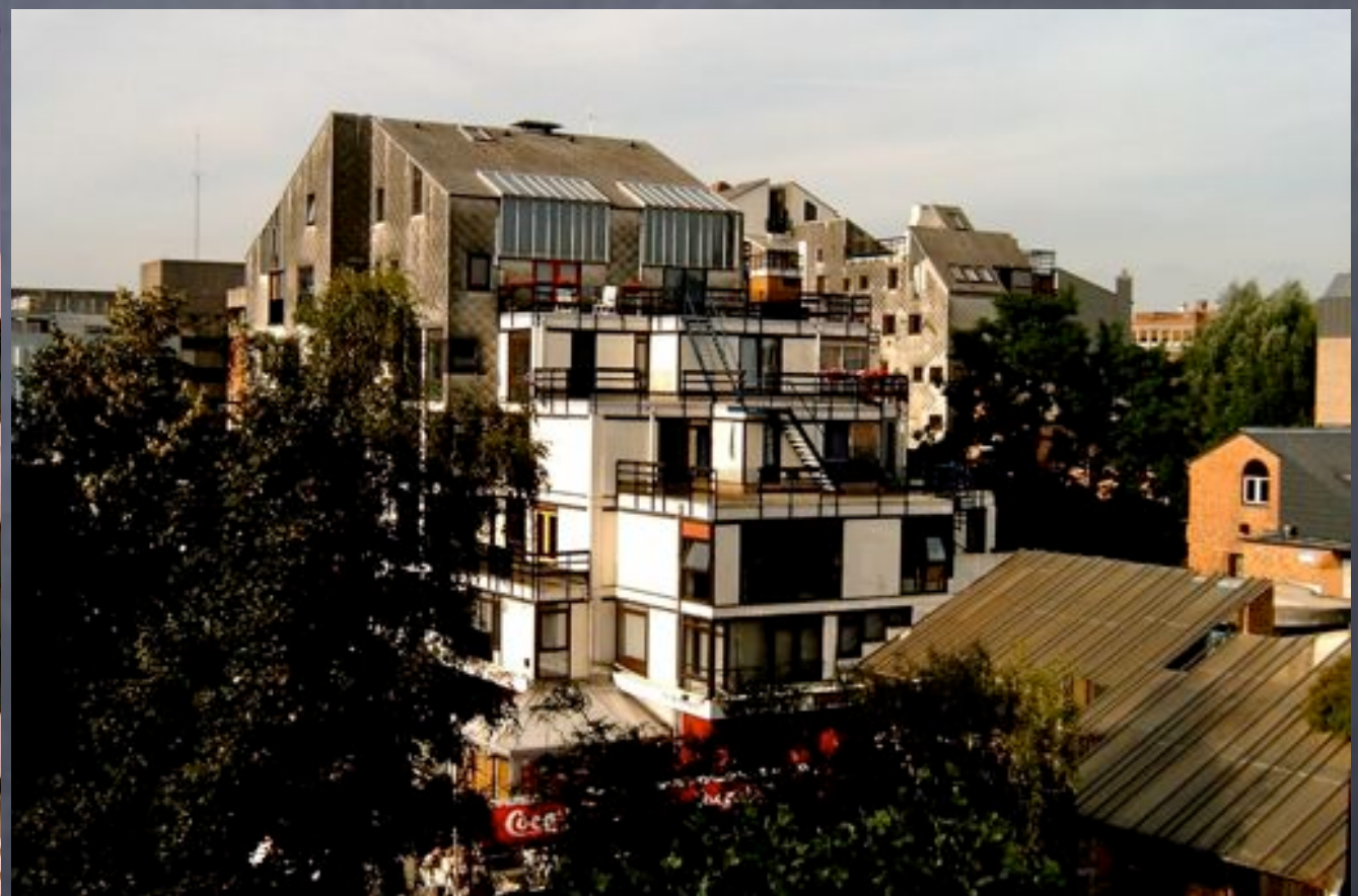
Richesse de l'habitat et qualité architecturale années 1980