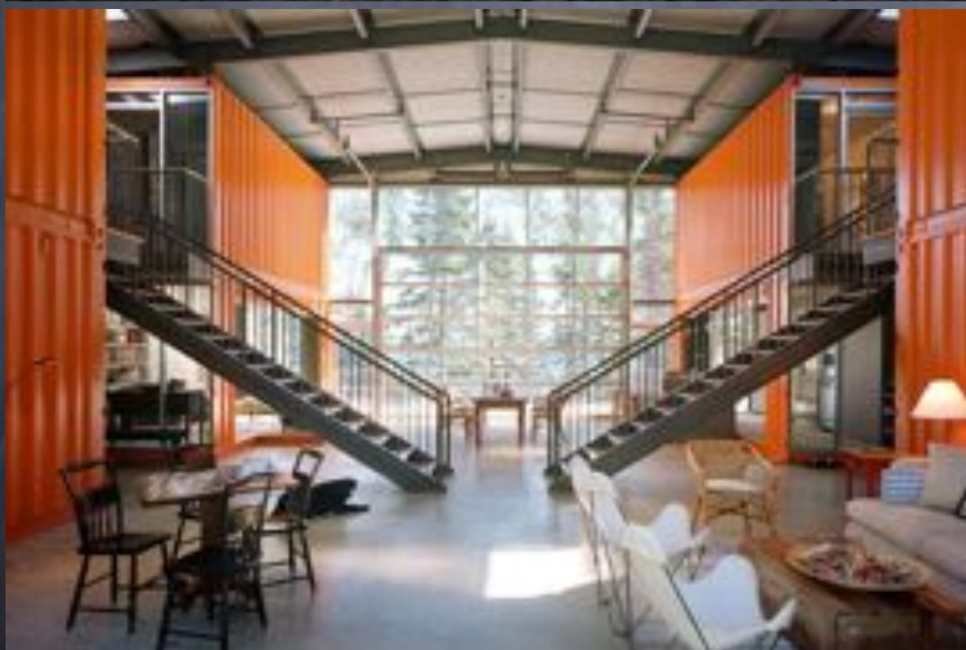
Habitat modulaire industrialisé