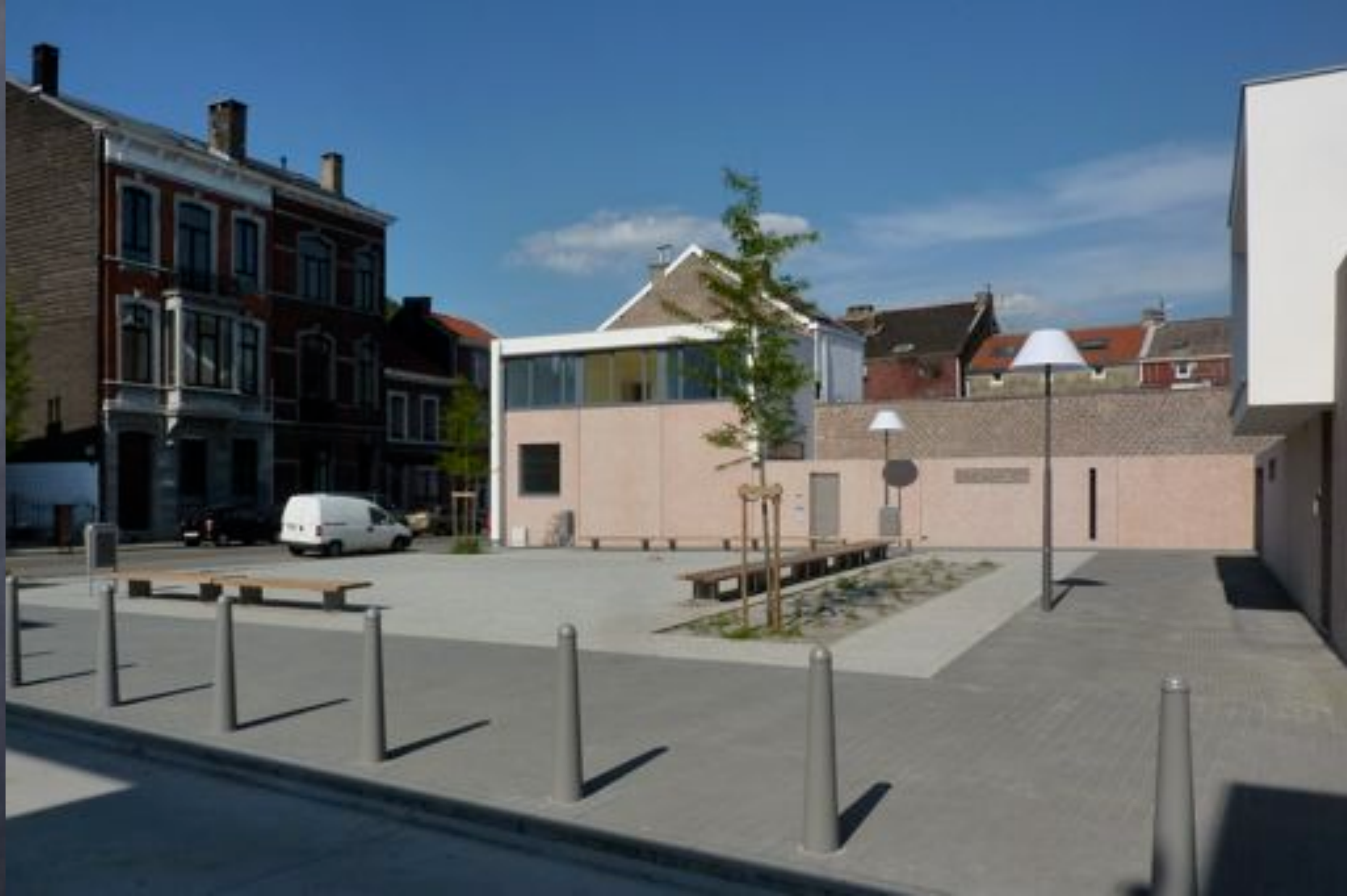
Liège, St Léonard, architecte P.Blondel