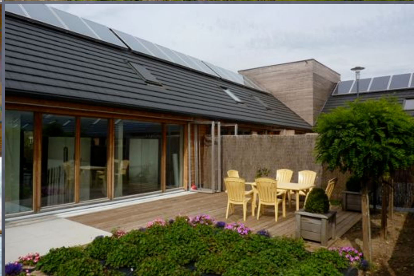
Tournai, Pic au vent: individuel et collectif