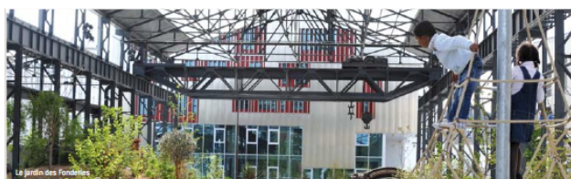
Al. Chemetoff Le jardin des Fonderies

Nantes, c'est aussi une ville qui, pour réaffecter son île, jadis dédiée aux zones portuaires, s'est adjointe les services des meilleurs urbanistes et architectes. Pour mieux comprendre ce phénomène totalement particulier, nous serons reçus à la Samoa, ensemblier des nouveaux espaces de l'île.