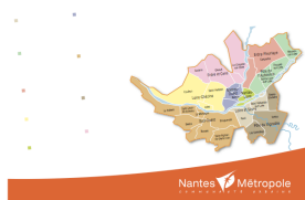
Carte des pôles de proximité

Nantes, ce sont aussi des stratégies de développement innovantes et cohérentes, ce sont de perpétuels champs d'expériences : un traitement soigneux de ses espaces publics, de ses logements publics, la création de nouvelles activités culturelles et touristiques, d'importants bâtiments durables, ... Pour mieux nous exposer cet ensemble de choix stratégiques, rien ne vaut un détour par Nantes-Metropole, siège de la Communauté Urbaine de Nantes, où les exposés ad-hoc nous seront détaillés.