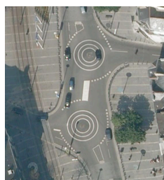
Cours des 50 otages