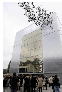
Maison des avocats

Nantes, c'est aussi une ville qui, pour réaffecter son île, jadis dédiée aux zones portuaires, s'est adjointe les services des meilleurs urbanistes et architectes. Pour mieux comprendre ce phénomène totalement particulier, nous serons reçus à la Samoa, ensemblier des nouveaux espaces de l'île.