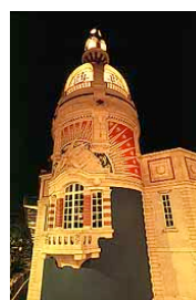
« Lieu Unique »